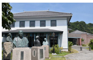
②津山洋学資料館 住所:津山市西新町5