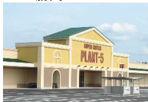
⑦PLANT-5 住所:苫田郡鏡野町布原 136番地