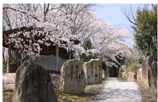
⑥川柳の小径・公園 住所:久米郡久米南町 下弓削・西山寺