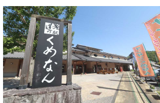
⑤道の駅 くめなん 住所:久米郡久米南町下二ヶ 1352-1