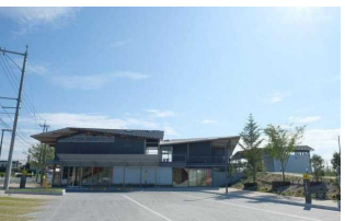
⑨ナギテラス 住所:勝田郡奈義町豊沢 314