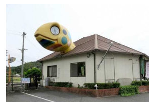
⑪JR亀甲駅 住所:久米郡美咲町原田 1748-5