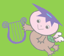
久米南町 カッピー