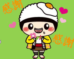
美咲町 みさっきー