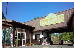
④おかやまファーマーズ・ マーケットノースヴィレッジ 住所:勝田郡勝央町岡1100