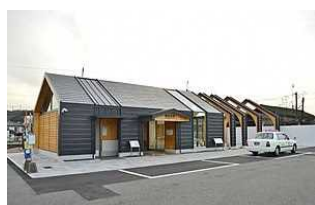
③JR勝間田駅 住所:勝田郡勝央町 勝間田765-3