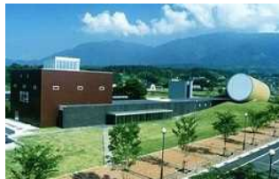
⑩奈義町現代美術館 住所:勝田郡奈義町 豊沢441