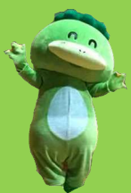
津山市 ごんちゃん