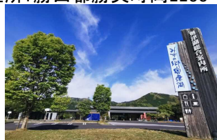
⑧水の郷奥津湖 住所:苫田郡鏡野町 河内60-8