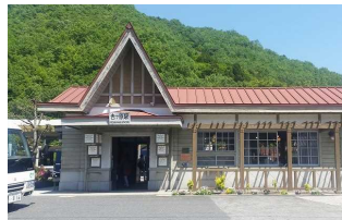
⑫旧片上鉄道 吉ヶ原駅舎 住所:久米郡美咲町吉ヶ原 432-1