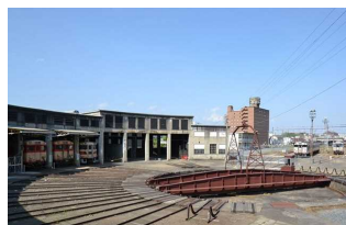
①津山まなびの鉄道館 住所:津山市大谷254-2