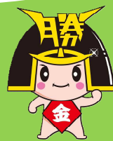
勝央町 きんとくん