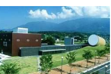
⑩奈義町現代美術館 [勝田郡奈義町 豊沢441]