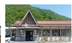
⑫旧片上鉄道吉ヶ原駅舎 [久米郡美咲町 吉ヶ原432-1]