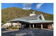
⑦奥津振興センター [苫田郡鏡野町 井坂495]