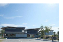
⑨ナギテラス [勝田郡奈義町 豊沢314]