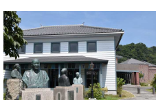
②津山洋学資料館 [津山市西新町5]