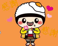
美咲町 みさっきー