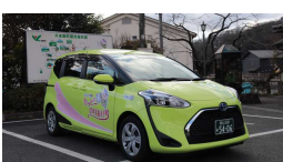
⑤カッピーのりあい号