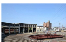
①津山まなびの鉄道館 [津山市大谷]

各ポイントでアプリからGPS認証を行うと取得できます。 ※チェックポイントに二次元コードは掲示していません。