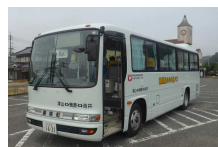
④柵原星のふる里バス、あさひチェリーバス、亀甲・津山線