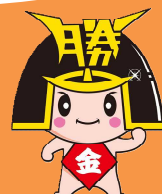
勝央町 きんとくん