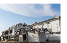
⑧ぶんぶんファクトリー [苫田郡鏡野町 円宗寺51-1]