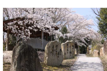
⑤川柳の小径・公園 [久米郡久米南町 下弓削・西山寺]