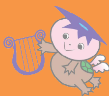
久米南町 カッピー