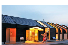
③JR勝間田駅 [勝田郡勝央町 勝間田765-3]