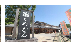
⑥道の駅くめなん [久米郡久米南町 下ニケ1352-1]