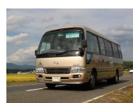
⑧勝央町ふれあいバス