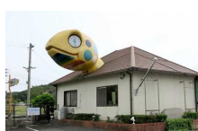
⑪JR亀甲駅 [久米郡美咲町 原田1748-5]