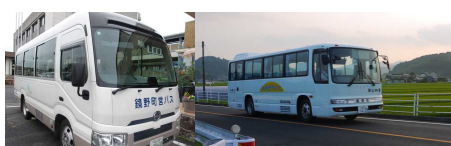
⑥かがみの町営バス、津山・富線共同バス