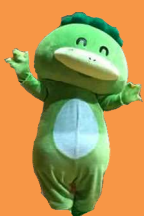
津山市 ごんちゃん