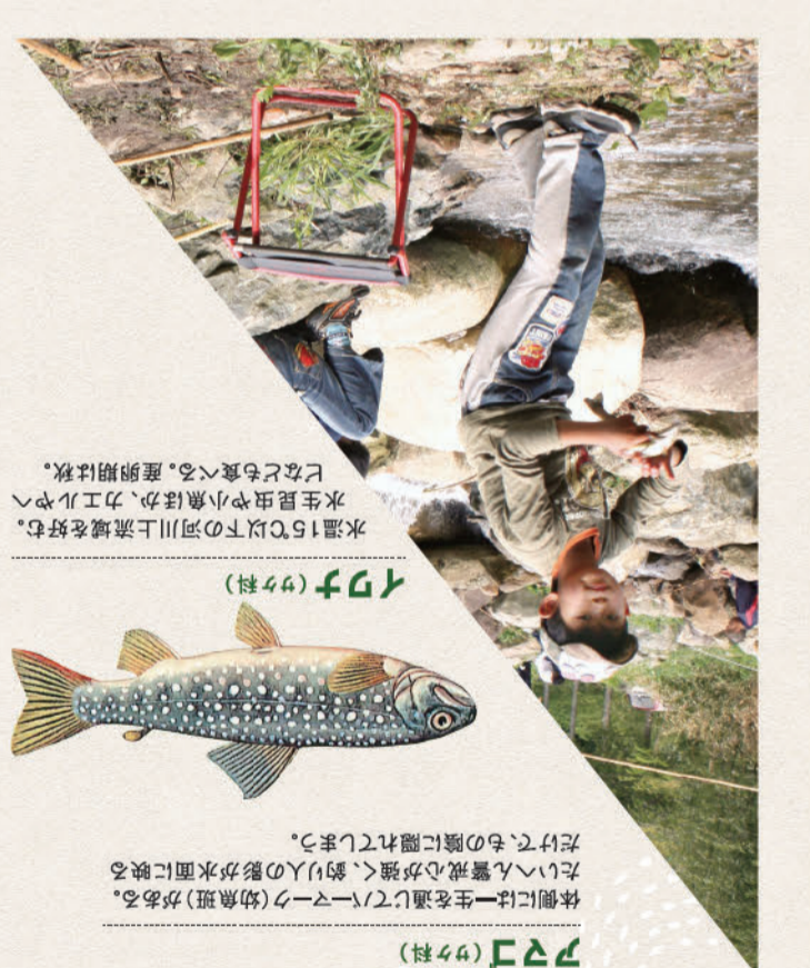
水温15℃以下の河川上流域を好む。水生昆虫や小魚ほか、カエルやへビなども食べる。産卵期は秋。