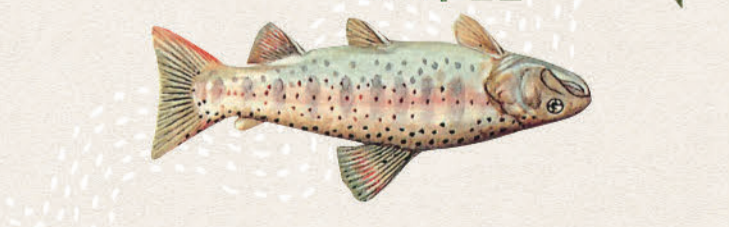
身体側には小黒斑が散在し、中央に1本の淡紅色の縦帯があるのが特徴。河川の中〜上流域に生息し、水性昆虫、小魚などを捕食します。